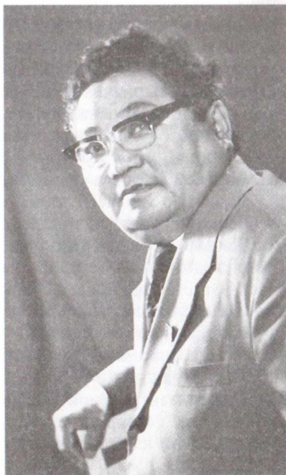
С.К. Ланзы, заслуженный художник РСФСР, заслуженный деятель литературы и искусства Тувинской АССР.

Новый этап в развитии изобразительного искусства Советской Тувы связан с именем С.К. Ланзы. Сергей Кончукович прославил Туву своими историческими картинами, панорамными пейзажами, национальными натюрмортами на всероссийских, всесоюзных и зарубежных художественных выставках. Благодаря ему искусство тувинских камнерезов становится широко известным во многих странах мира. При его активном содействии на первом учредительном съезде художников Тувы весной 1965 г. формируется Тувинское