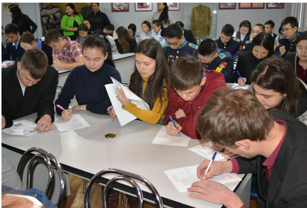
Городская олимпиада, посвященная 70-летию Победы Сталинградской битвы среди школьников и кадетов общеобразовательных учреждений.