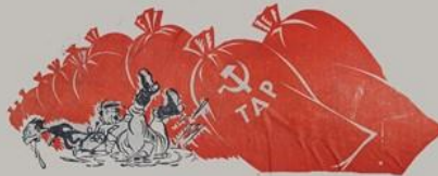
По фронту людям краем граней грозный урожай!