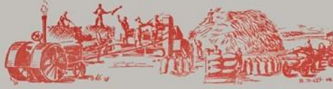
Убрать военный урожай и сохранить его на славу.