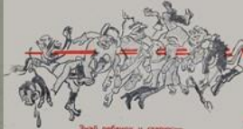
Этой робиней и стариком нашей колеснице идти.