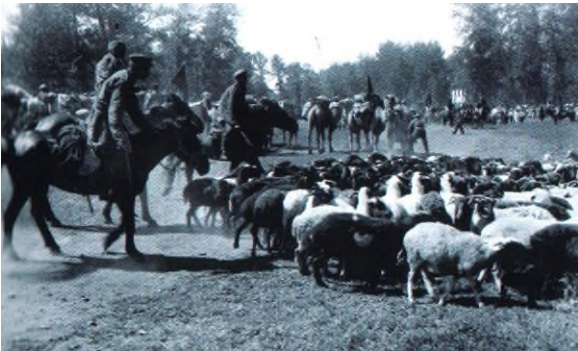
Материальная помощь фронту